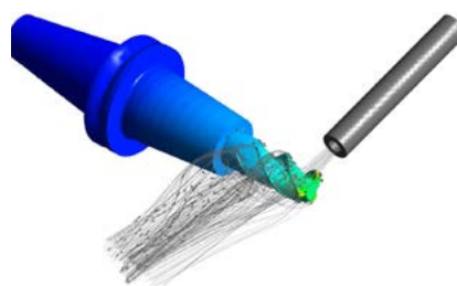
Maschinen-Prozess-Analyse zur gezielten Wärmeabführung