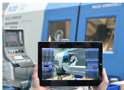
Monitoring einer Werkzeugmaschine durch Daten-Visualisierung mit Augmented Reality