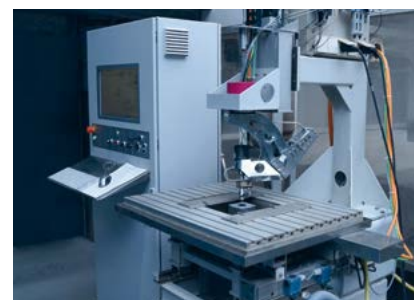
Versuchsstand zur 3D-Wasserabrasiv-Feinstrahlbearbeitung