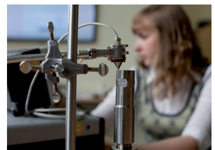
Versuchsstand für Ultraschallaktoren