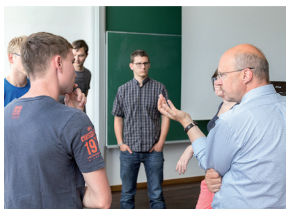
Diskussion bei Lehrveranstaltung