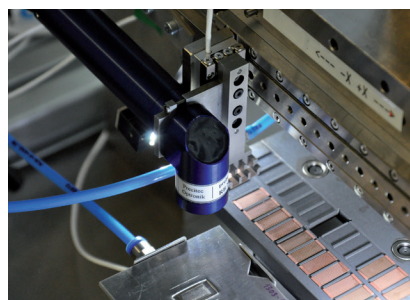
Integration von Piezoaktoren