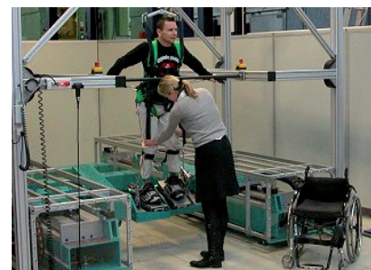
Reha-Roboter zur Schlaganfallrehabilitation