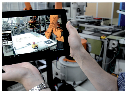
Cloudbasierte Augmented-Reality-Simulation einer Robotersteuerung