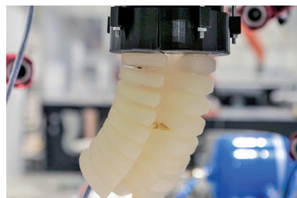
Soft Material Robotics - Soft pneumatischer Aktor aus dem 3D-Drucker

Neben der Forschung setzt sich das Team in der Lehre für den Einsatz moderner Konzepte und Methoden ein, um die Studierenden mit vielen praktischen Projekten und Modulen für die Anwendung der theoretischen Inhalte zu begeistern.