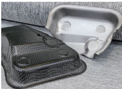
Hybridbauteil – Verbund aus Metal und faserverstärktem Kunststoff (Textil)