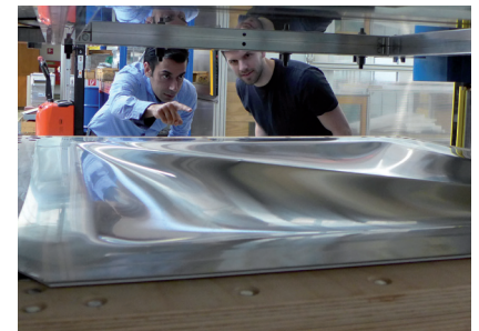
Umformwerkzeug zur Herstellung großflächiger Gebäudefassadenelemente